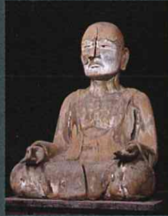
徳一坐像 勝常寺 湯川村指定文化財