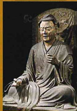
維摩居士坐像 興福寺 国宝