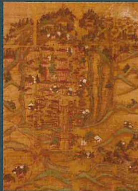
恵日寺絵図 恵日寺 福島県指定重要文化財