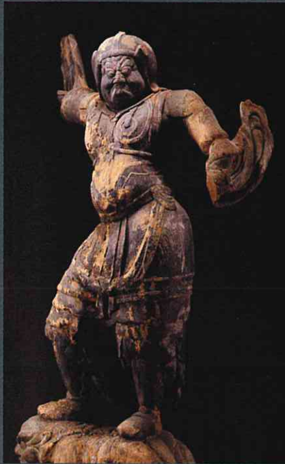
四天王立像 持国天 勝常寺 重要文化財