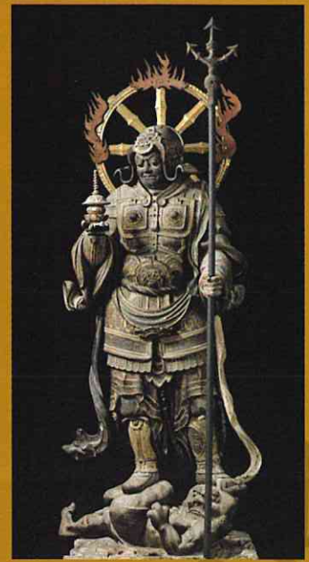
四天王立像 多聞天 興福寺(東金堂所在) 国宝