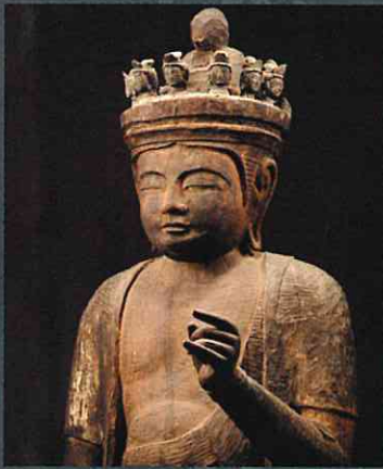
十一面観音菩薩立像 明光寺 福島県指定重要文化財