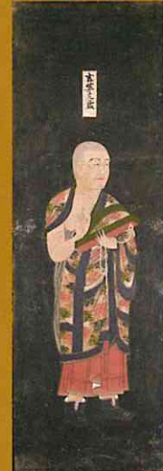
玄奘像 ※後期 護法善神扉絵 興福寺