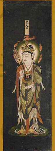
梵天像 ※前期 重要文化財