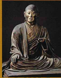
法相六祖坐像 常騰 興福寺 国宝